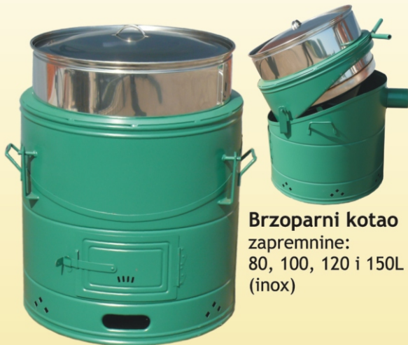
Brzoparni kotao zapremnine: 80, 100, 120 i 150L (inox)