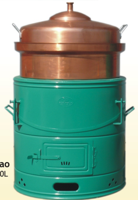
Rakijski kotao zapremnine 150L