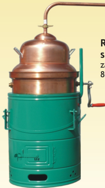
Rakijski kotao s mješalicom zapremnine: 80, 100, 120 i 150L