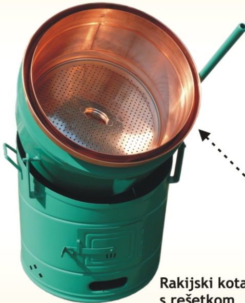
Rakijski kotao s rešetkom zapremnine: 80, 100, 120 i 150L